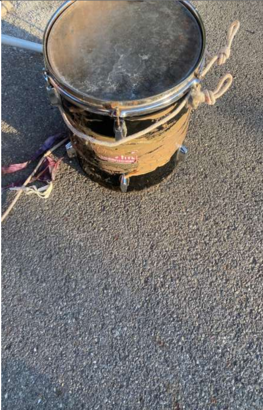
Tamburo ad una battuta