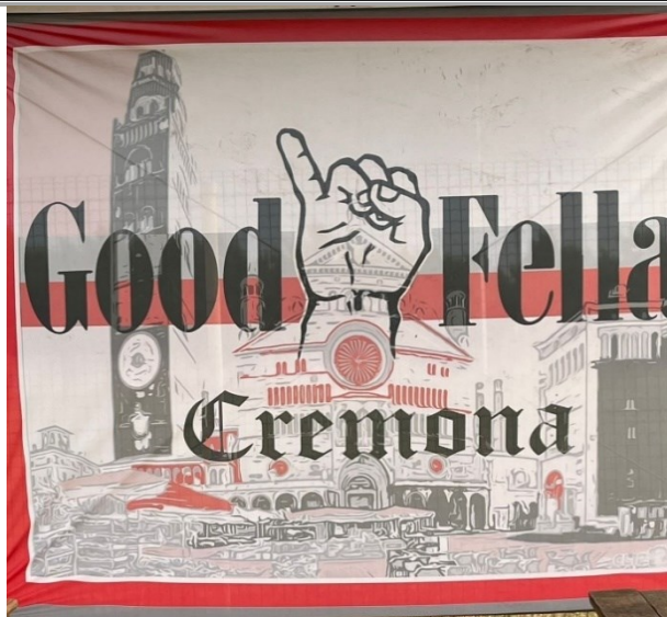
Immagine Commemorativa Componente Scomparso Scritta "You'll always a GoodFellas"

GRUPPO: GOOD FELLAS MISURA 2.50X 2.30 SETTORE DI ESPOSIZIONE: TUTTA LA STAGIONE MATERIALE : TELA NAUTICA ASTA -PLASTICA TELESCOPICA 0.55X4.50